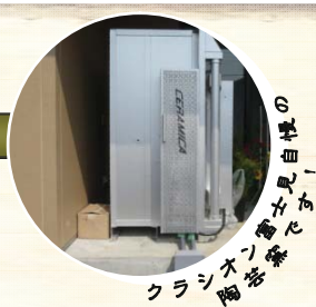
クラシオン富士見自慢の クラシオン陶芸教室です！